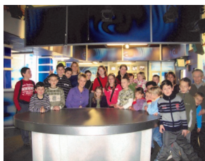
Z wizytą w TVP Kraków

Dla tych, którzy mają ochotę poczytać rymowanki, które nadeszły do nas w ramach konkursu zapraszamy na stronę www.glogoczow.pl -> Zrealizowane projekty -> Ferie na 5 . Dobra zabawa gwarantowana.