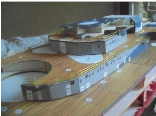
Fot. Okręt składający się z ok. 700 części w trakcie prac

decydujące znaczenie, jest nam potrzebny do wykonania modelu, gdyż nawet największa część, którą musimy skleić, pochłonie nam tego czasu sporo - musimy być uważni w tym co robimy. Drobną nieuwagą i niedokładnością może przynieść skutek odwrotny do zamierzonego i z modelu, który by stał na półce, robi się podpałka do pieca. Wybrałem część największą do sklejenia, kierując się zasadą, że jeśli duża część nam sprawi kłopot, to wiadomo co będzie, jeśli przyjdzie nam skleić część, która ma w średnicy ok. 1 [mm]. Dla jednych sklejenie modelu może zająć 1 rok, a dla innych nawet kilka lat. Wtedy na półce w domu lub mieszkaniu stanie to, nad czym pracowaliśmy przez ten okres.